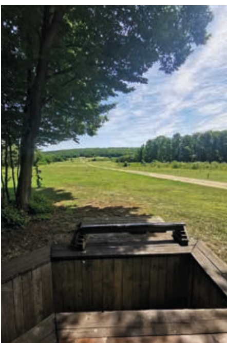
Eine Ausblick aus der Schießanlage auf eine Schießbahn

Ziel dieser Gefechtsschießen ist es, realitätsnahe Szenarien zu erstellen. In der Planung des Gruppengefechtsschießens werden gerade verschiedene Pläne eingearbeitet. Zum Beispiel das Stellung-Beziehen neben und auf diversen Gebäuden, die Nutzung diverser Grabensysteme etc. Insgesamt wird dieses Scharfschießen sicher mehr als die üblichen Übungen des Sturmgewehrs und der Pistole beinhalten. Man darf in freudiger Erwartung gespannt sein ... 📍