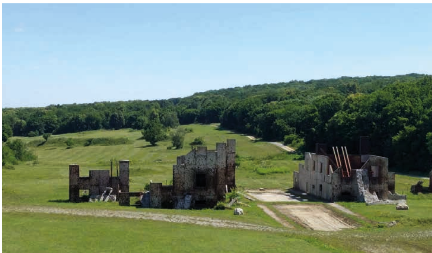
Ein Blick auf die Gruppengefechtsschießanlage: Dynamik beim Feuerkampf ist Teil der Ausbildung.