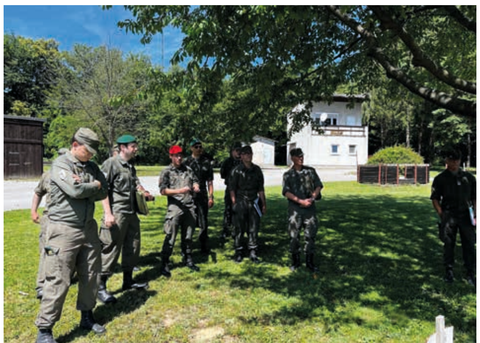
Das Erkundungsteam des Jägerbataillons Wien 1 bei der Erkundung der Schießbahnen