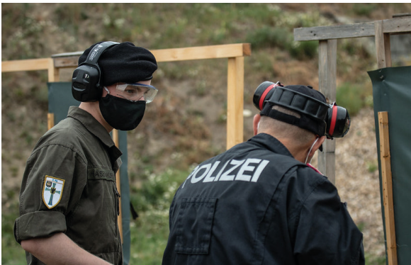
Einsatzvorbereitung Covid 19 2020