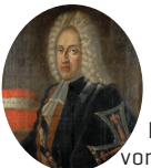
Franz Ludwig von Pfalz-Neuburg