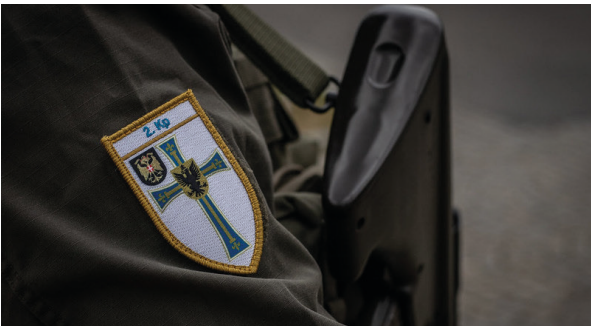
2.JgKp/JgB WIEN 1 Hoch- und Deutschmeister

Es darf auch die Komponente Musik, Kunst & Kultur nicht fehlen, die einen wesentlichen Einfluß in das Deutschmeisterleben und Wesen hatten und auch noch bis heute haben.